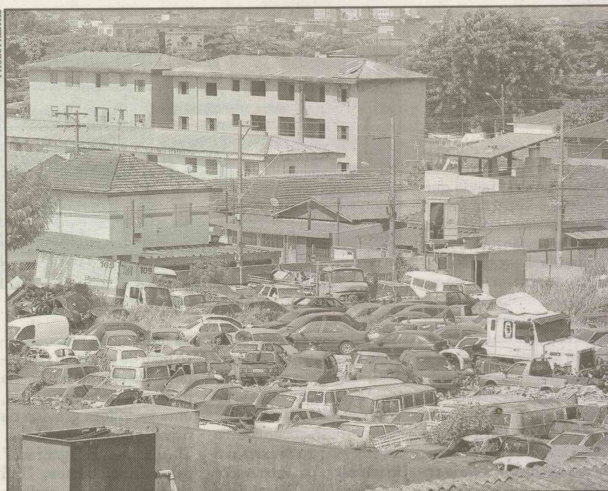
O amontoado de carros, muitos com vidros abertos e avarias, viram focos do mosquito da dengue